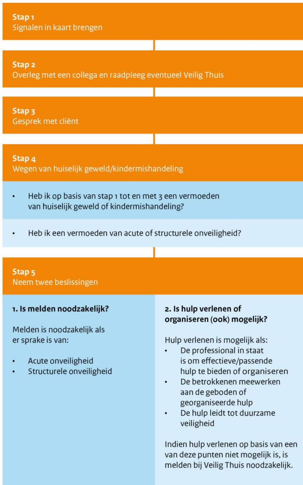
Figuur 1: Stappenplan verbeterde meldcode